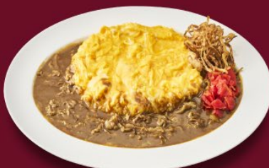
オム玉ビーフカレー