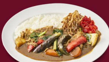
野菜ビーフカレー