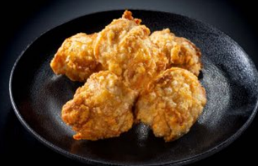
カリカリから揚げ